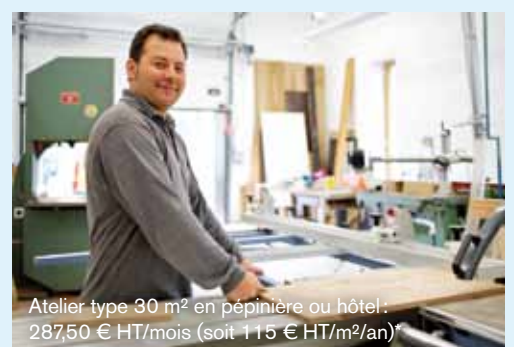
Atelier type 30 m 2 en pépinière ou hôtel : 287,50 € HT/mois (soit 115 € HT/m 2 /an)*

* : Électricité, eau, chauffage, accès internet et nettoyage des parties communes compris