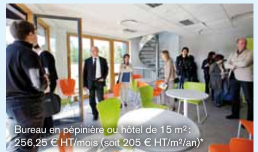
Bureau en pépinière ou hôtel de 15 m 2 : 256,25 € HT/mois (soit 205 € HT/m 2 /an)*