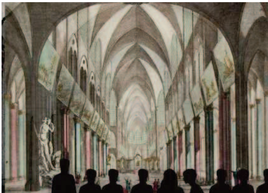
Mapping architectural de la Cathédrale Notre Dame