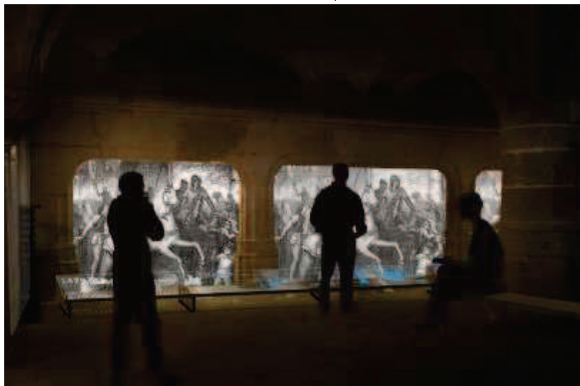
Mise en lumière d'une scène historique dans les alcôves

L'esprit de la proposition scénographique de l'Agence Clémence Farrell a retenu l'attention du jury car il respecte le scénario écrit par CMC et validé par le comité scientifique. De plus, il apporte des solutions muséographiques contemporaines et innovantes pour rendre plus attractif le parcours lié à l'épopée de Jeanne d'Arc à travers son procès en réhabilitation et pour la seconde partie, représenter l'histoire et le mythe qu'elle a suscité à travers les siècles.