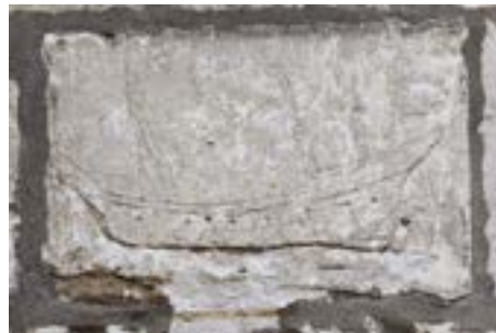
De nombreux graffitis de bateaux sont présents sur le mur sud de l'édifice.