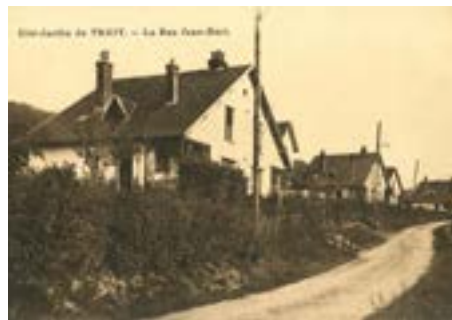
La rue Jean-Bart, rue de la cité-jardin du Trait, est également connue sous le nom de « rue des bas de soie » car les femmes qui y habitaient avaient, disait-on, suffisamment de moyens pour s'acheter des bas en soie.

Au Trait, la cité-jardin s'organise en reproduisant l'organisation hiérarchique de l'usine. À flanc de coteaux, les plus grandes maisons sont réservées aux ingénieurs et directeurs. Les ouvriers, eux, logent dans des maisons souvent jumelées, plus près de la Seine et donc, de l'usine