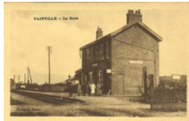
L'ancienne gare Yainville-Jumièges