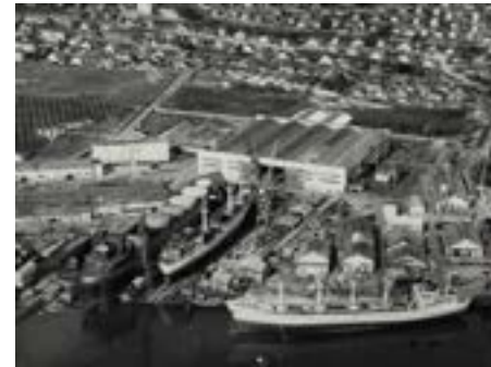
Chantier naval du Trait – début des années 1960