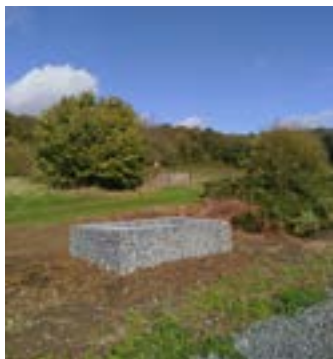
Gabion sur le bord de la voie pouvant servir de refuge à la biodiversité présente