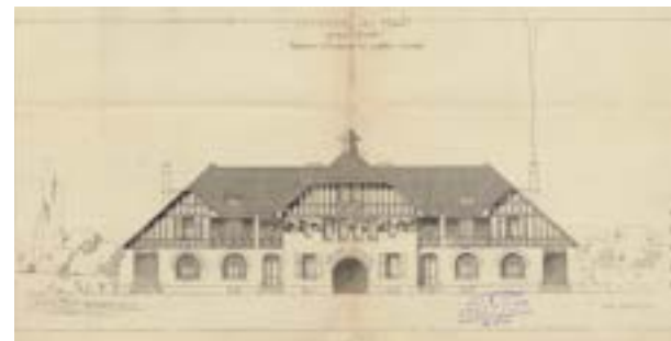
Plan de l'école Flaubert, Pierre Lefebvre, architecte à Rouen, 1928