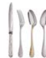
Couverts Christofle, modèle « Jardin d'Eden », créé en 2010, collection actuelle