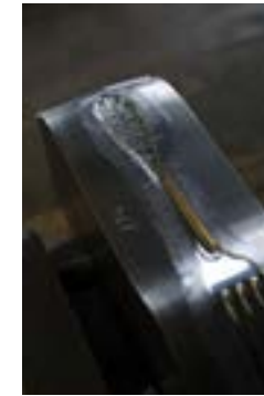
Matrice de couvert Christofle