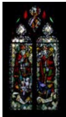
Vitraill représentant saint Nicolas et saint Éloi, réalisé par Max Ingrand, 1956.