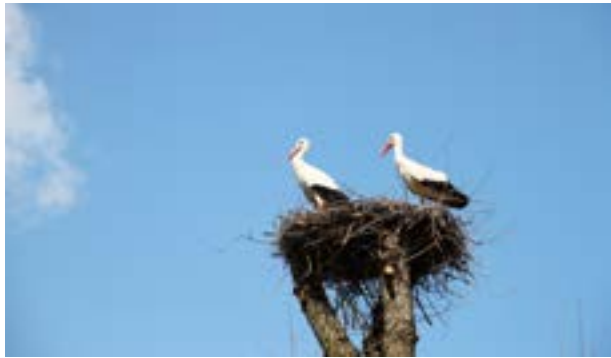
Cigognes - Marais du Trait - 2010