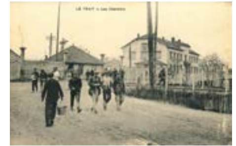
Sortie des ouvriers du chantier naval