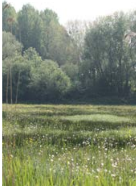
Marais du Trait - 2009