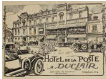
Réclame Hôtel de la Poste - Spécialité canard à la Denise - Début 20 e siècle