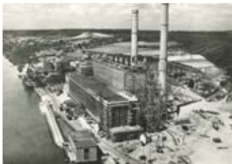
La centrale électrique de Yainville, vers 1948 (sur cette photo on voit Yainville II en cours de construction)