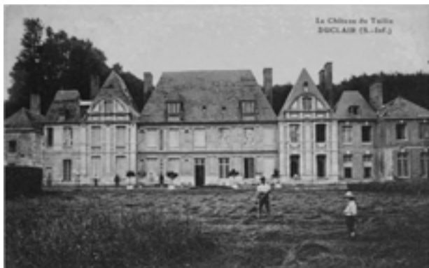
Le château du Taillis en 1905