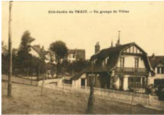
Groupe de villas de la cité-jardin du Trait