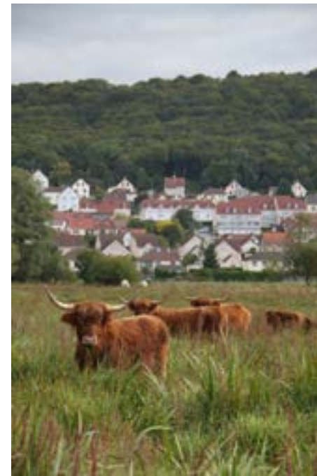
Vaches dans le marais - 2012

Cette balade patrimoine à vélo s'arrête ici. Mais d'autres possibilités de découverte des différents patrimoines du territoire sont possibles.