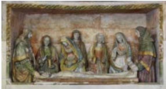
La mise au tombeau, groupe sculpté daté de la première moitié du 16 e siècle.