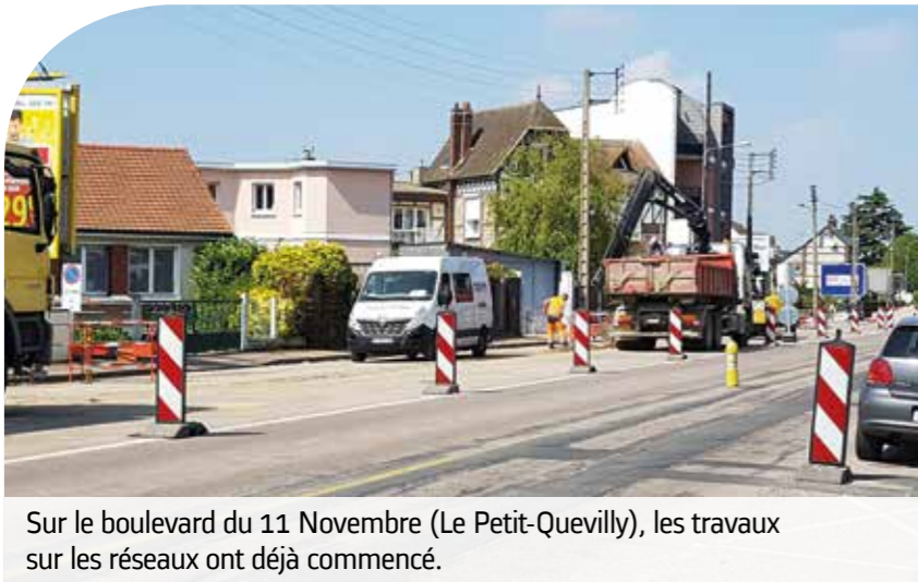
Sur le boulevard du 11 Novembre (Le Petit-Quevilly), les travaux sur les réseaux ont déjà commencé.