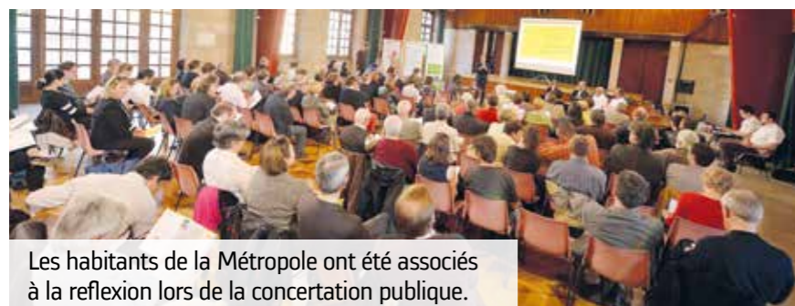
Les habitants de la Métropole ont été associés à la réflexion lors de la concertation publique.

Pour anticiper la fermeture de l'accès à la rue Louis-Poterat depuis l'avenue de la Libération, les services de la Ville de Rouen, de la Métropole et les riverains du quartier se sont réunis afin de mener une réflexion sur la circulation dans le secteur. Une 1 re phase d'expérimentation a eu lieu fin 2016 sur les rues Masqueray et Lair.