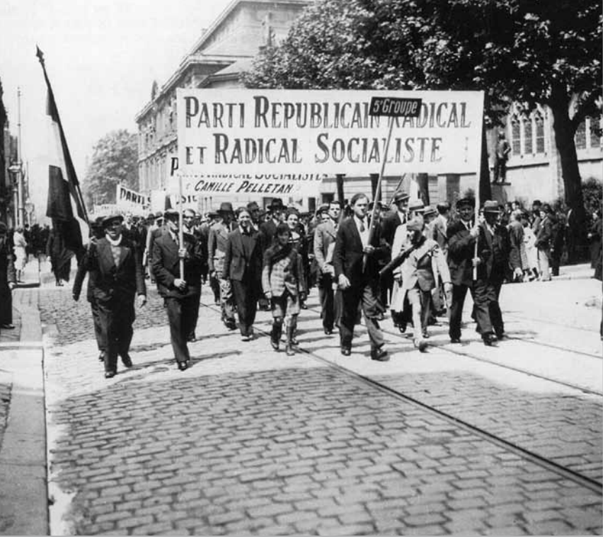
PASSAGE DU COMITÉ RADICAL-SOCIALISTE DU MONT-GARGAN DANS LA RUE THIERS, DRAPEAUX TRICOLORES EN TÊTE, MANIFESTATION DU 14 JUIN 1936.