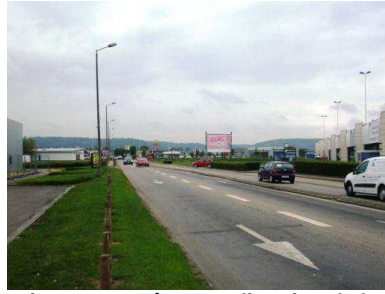
La route de Pont de l'Arche, support des perceptions paysagères en direction de la vallée

Dans le cadre de la préservation de ces espaces, il importe donc de les préserver de toute installation susceptible de nuire à leur qualité paysagère.