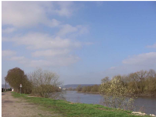
La Seine vu depuis le chemin de Halage

Parmi les entités paysagères de la ville, la vallée de la Seine est fortement présente au Nord de la commune. Elle s'appuie sur des paysages ouverts, travaillés et façonnés par l'activité maraîchère. La Seine, dans laquelle vient se jeter le bras de l'Eure, vient souligner le rôle important de l'eau dans ce site encadré par un cortège arboré favorisant une ambiance intimiste et calme.