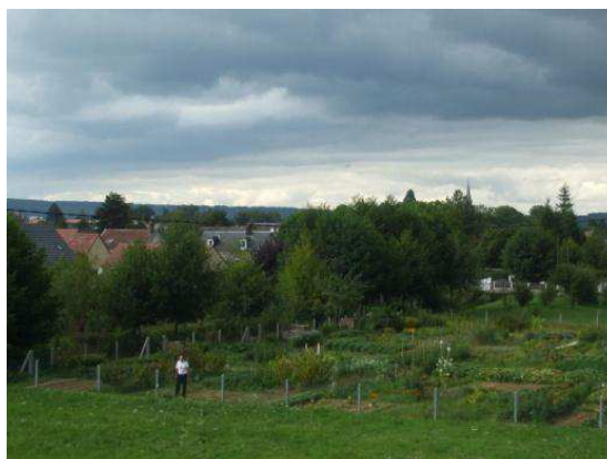
Des espaces de respiration en bordure de l'Oison

Les vallées de l'Oison, du Grand Ravin et de la Fieffe convergent au sud de la commune et offrent des fenêtres sur des paysages verdoyants, encaissés et libres de construction.