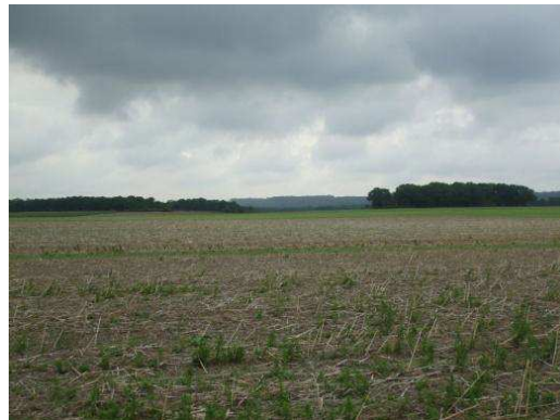
Le maraichage, un savoir-faire local constitutif de l'identité paysagère de la vallée

La préservation de ces espaces naturels doit trouver sa traduction à travers la protection des sites vis-à-vis de l'affichage publicitaire.