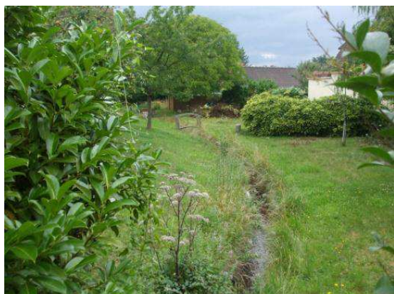
L'Oison, une présence de l'eau au sein des tissus bâtis