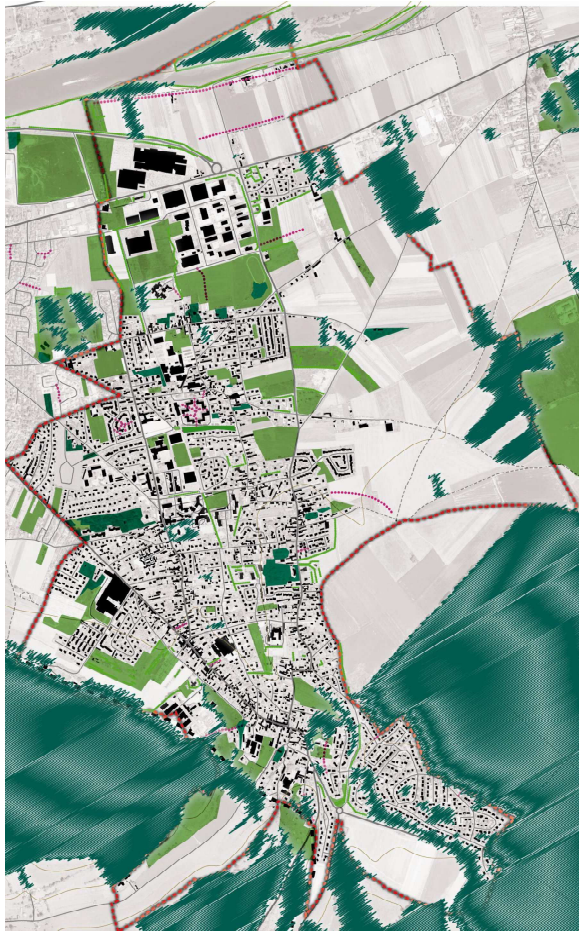
La trame verte urbaine

Etant donné que tout dispositif publicitaire est interdit sur des arbres, et afin d'assurer la cohérence paysagère de ces zones, il importera de circonscrire l'affichage publicitaire à proximité de ces espaces boisés classés.