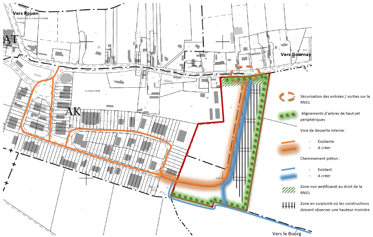
22 Plan Local d'Urbanisme de la commune de Saint-Jacques-sur-Darnétal • Orientations Particulières d'Aménagement