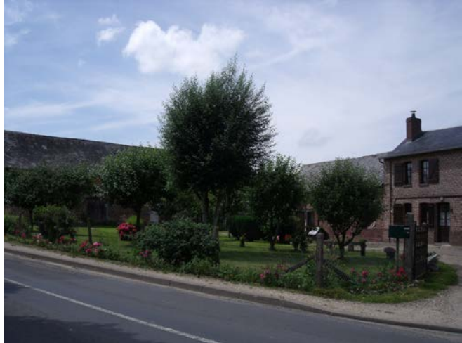
rué de Darnétal à Préaux Parcelles A1219 – A1220 – A901

Préservation de la typologie et du carrefour : bâtiments et abords.