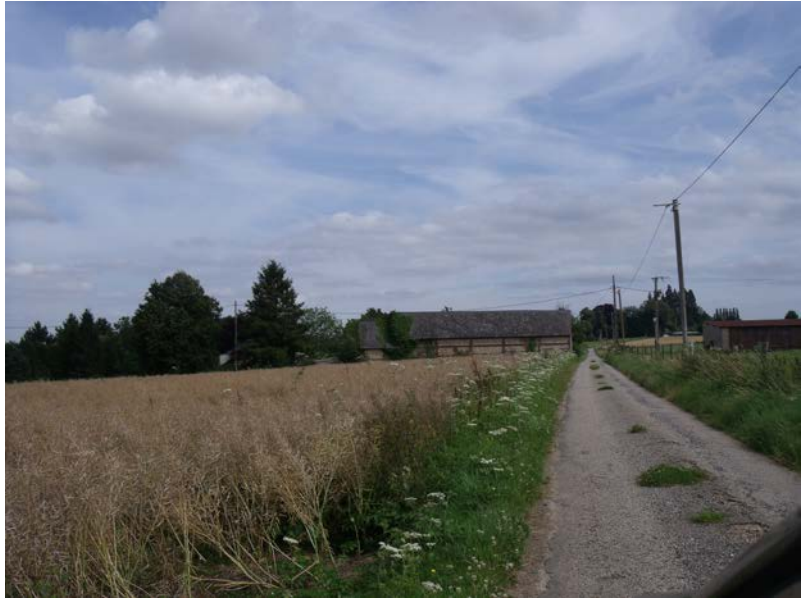
CR de la Robinette Parcelle A1218

Préservation de la typologie architecturale, la perception lointaine : bâtiments et abords.