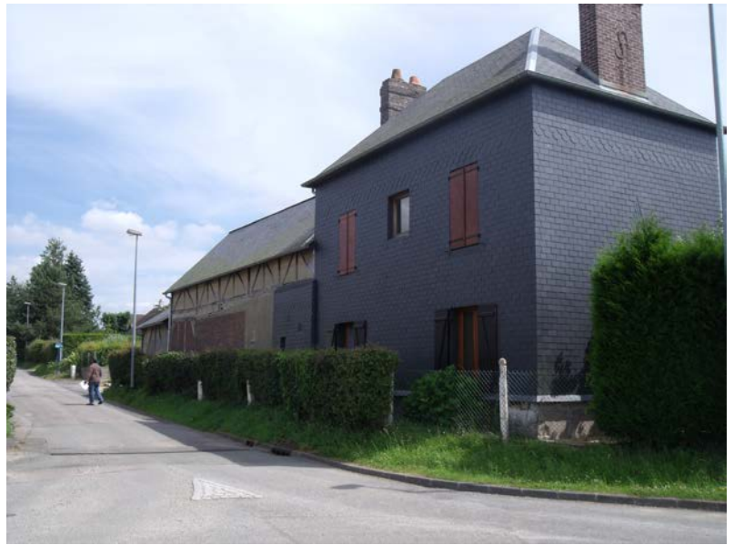
Rue des Trois Fermes Parcelles A1255

Préservation de la typologie urbaine :bâtiments et abords