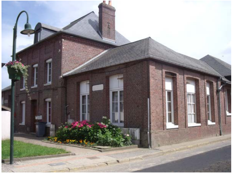
Rue Emouquets Parcelle A247

Préservation de la forme urbaine et architecturale : bâtiments et abords