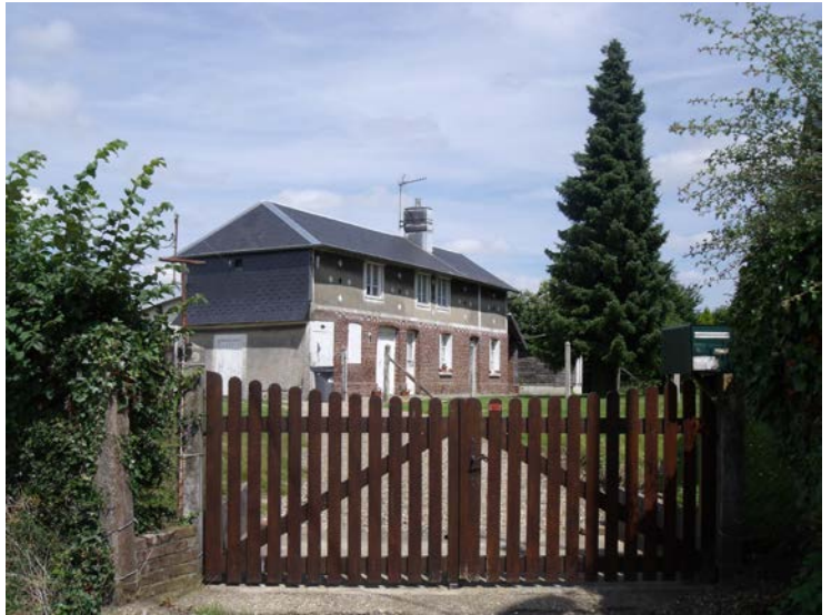
595 rue Carrouget Parcelle A195

Préservation de la typologie architecturale : bâtiments et abords .