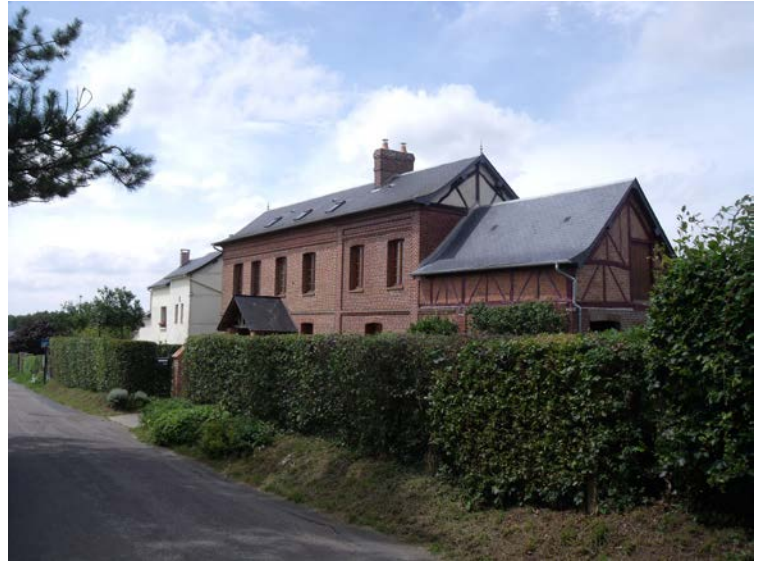
252 Rue des Trois Fermes Parcelles A811 – A881

Préservation de la typologie urbaine : bâtiments et abords