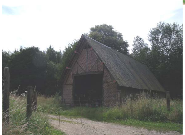
CR de la Robinette Parcelles A1212 – A20