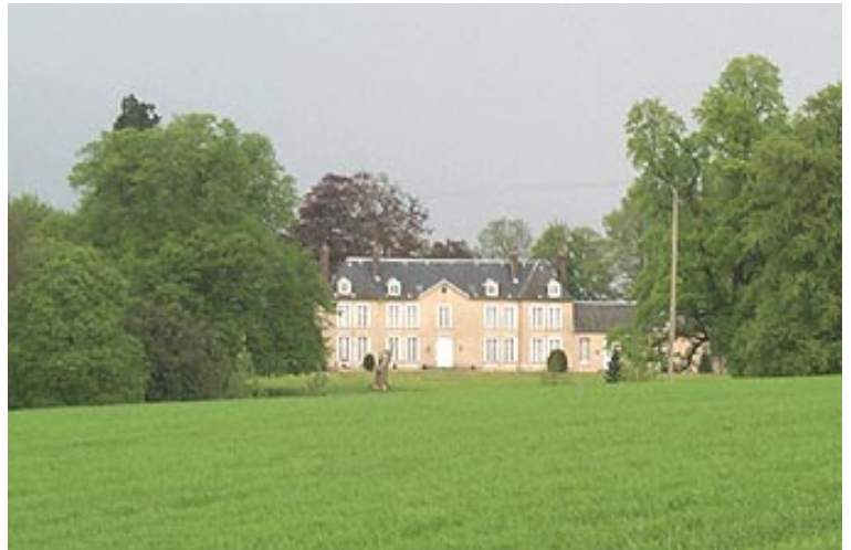
Lieu-dit Château de Guillerville Parcelles A216 – A1217 – A389 – A329 – A1306