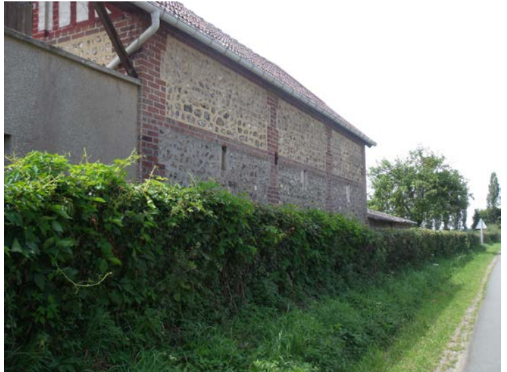
Rue des Trois Fermes Parcelles A1263 – A1262

Préservation de la typologie urbaine : bâtiments et abords.