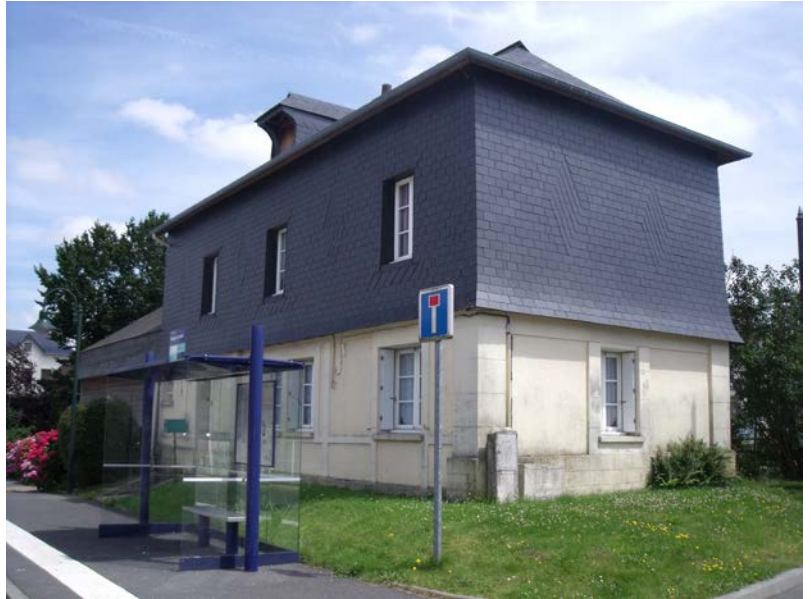
114 rue de l'Eglise Parcelles A1293 – A1148

Préservation de la forme architecturale : bâtiments et abords.