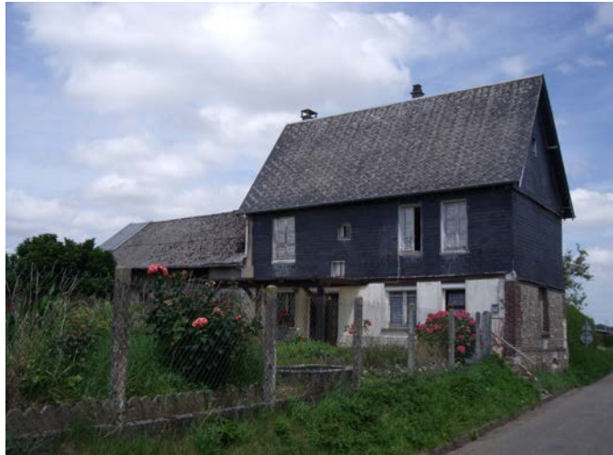
rue de l'Eglise Parcelle A1100

Préservation de la forme architecturale : bâtiments et abords