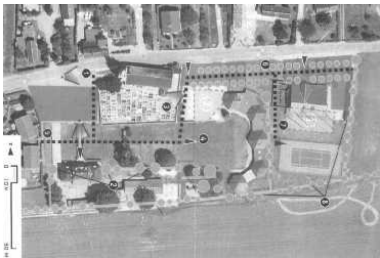
Esquisse d'aménagement