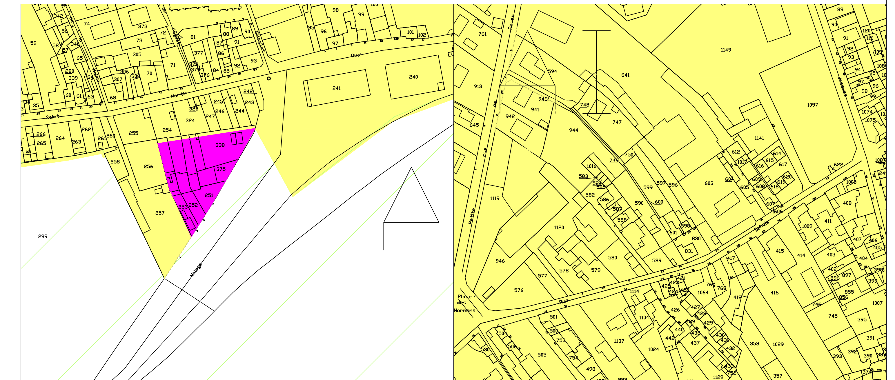
Petite rue de Rouen