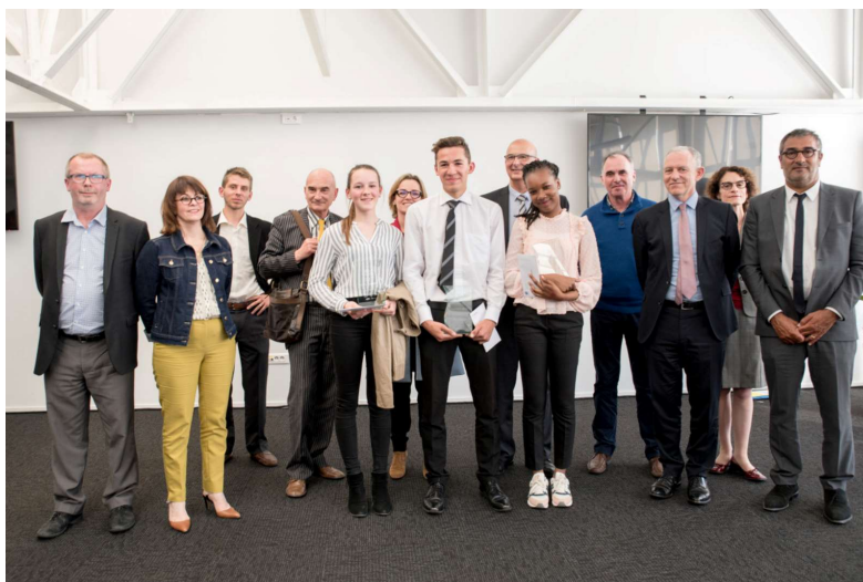
Lauréats 2017