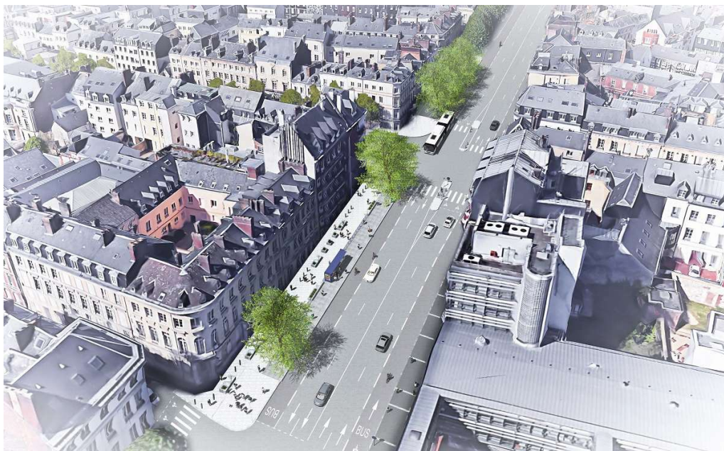
Visuel de projection – Boulevard des Belges, vue sur la future station Vieux Marché Ouest

La ligne T4 proposera sur 8,5 km une nouvelle offre de déplacement rapide Nord-Sud dans la Métropole Rouen Normandie, entre le Boulingrin et le Zénith. En site propre, cette future ligne de Bus à Haut Niveau de Service intégrera de nouveaux espaces paysagers et arborés le long de son tracé. Les travaux d'aménagement du projet T4 sur la rive droite ont commencé en Février 2018. Sur les boulevards de la rive droite, les importants travaux sur les réseaux se poursuivent tandis que l'espace public prend progressivement sa forme définitive, notamment le long du boulevard des Belges