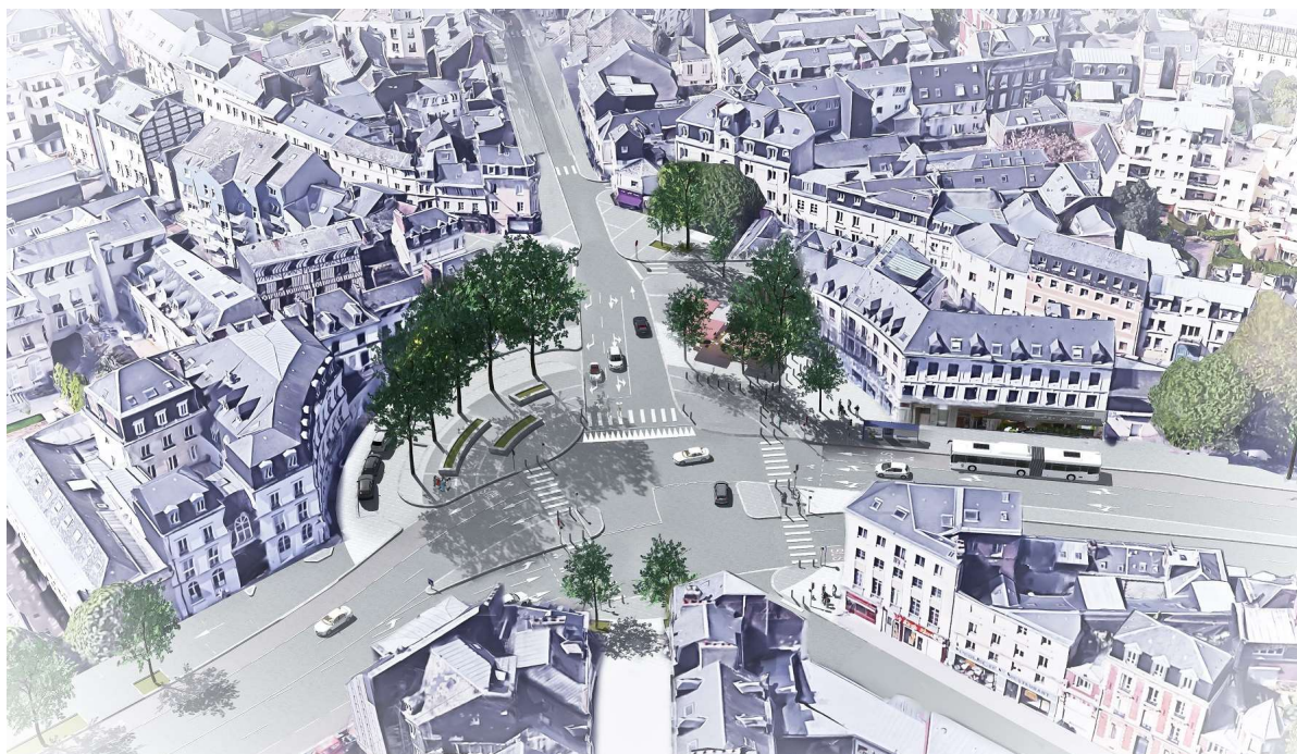
Visuel de projection – Place Cauchoise

Les travaux de la place entraîneront des modifications provisoires de circulation autour des rues Saint Gervais et Renard, fermées respectivement du 9 Juillet au 31 Août pour la première, et en Août pour la seconde.