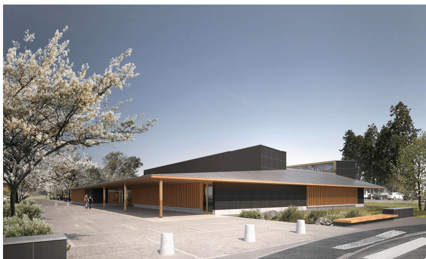
ATELIER FERET & FRECHON ARCHITECTES