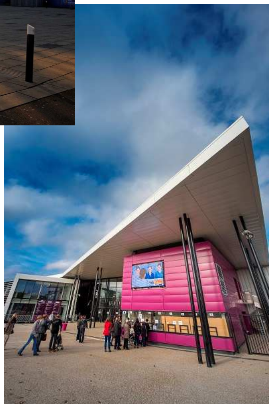
Parc des Expositions