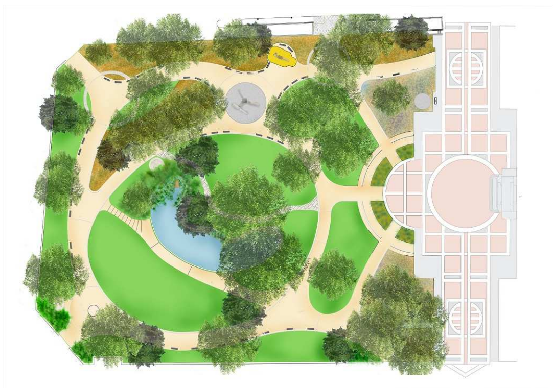
Plan de masse du projet de réaménagement du Square Verdrel

L'objectif est d'offrir aux habitants un lieu de promenade qualitatif en centre ville avec une continuité entre le jardin, le parvis et le musée.