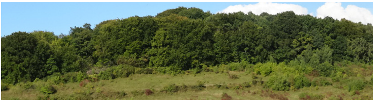
Les plateaux calcicoles des coteaux de la Métropole