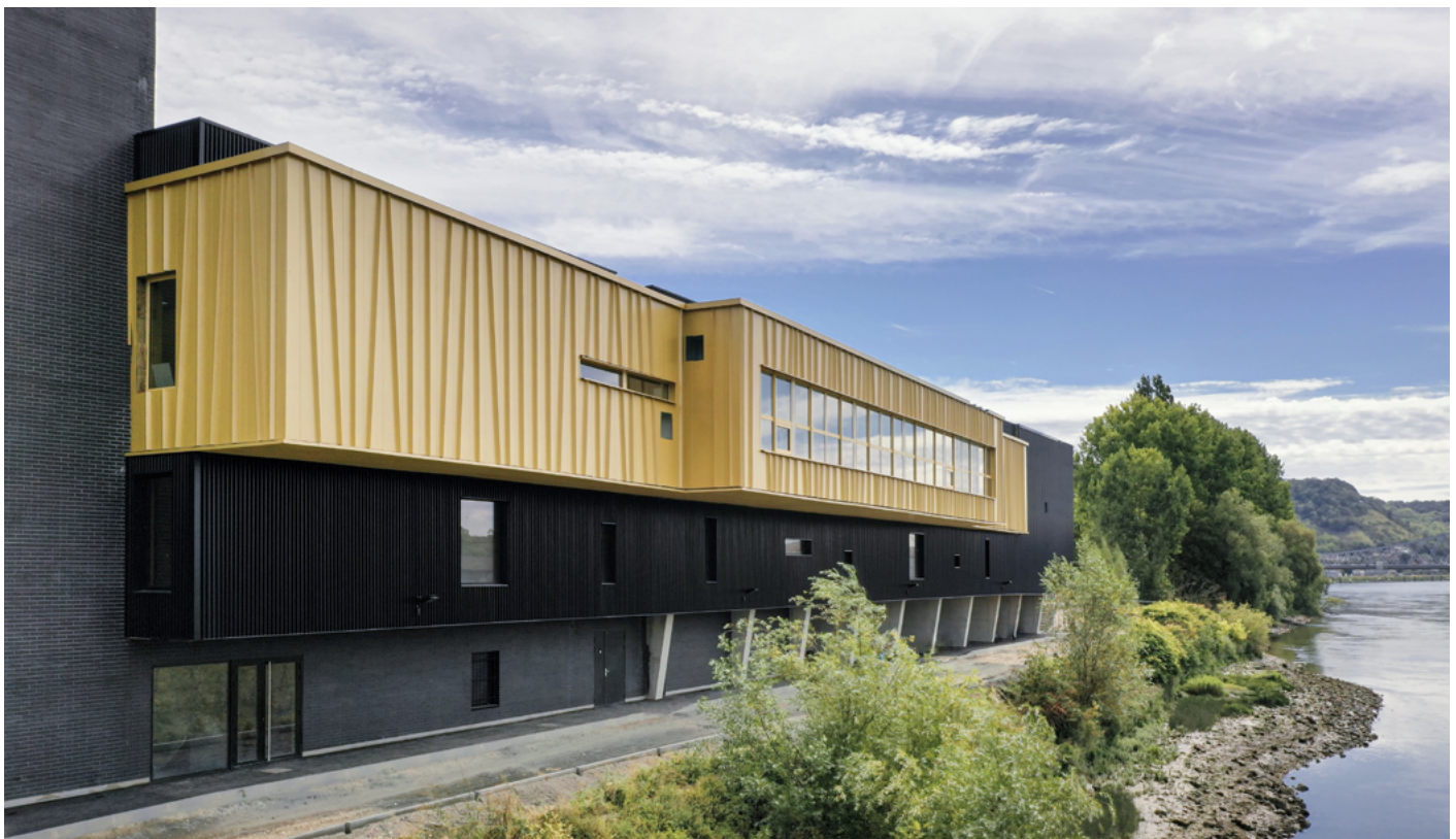
Métropole Rouen Normandie Janvier 2021