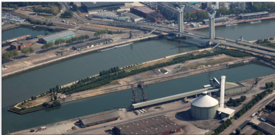
Vue aérienne de la butte avant les aménagements côté Sud – Crédit : 4Vents / RNA

Les besoins en déblais de terre saine de la butte paysagère étant conséquents, à l'été 2017, le projet d'aménagement de la ZAC Luciline a effectué des travaux de terrassements générant un excédent de terres d'environ 5000 m 3 . Au vu de l'économie circulaire, écologique et financière à réaliser, les terres excédentaires de la ZAC Luciline ont été évacuées au sein de la butte.