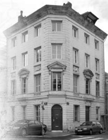
IMMEUBLE DÉBUT XIX e SIÈCLE