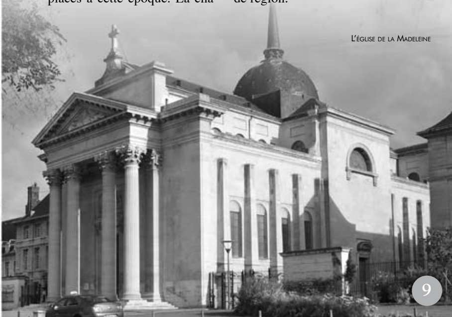
L'ÉGLISE DE LA MADELEINE

pelle est transformée en église paroissiale en 1790. L'hôpital est désaffecté en 1990 et les bâtiments réaménagés pour l'installation de la préfecture de région.