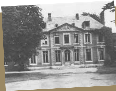
Château des Marettes

16. La station de métro est souvent comparée à un animal, lequel ?