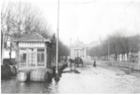
Avenue Pasteur vers 1910