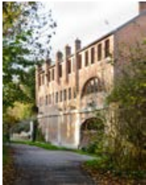
Ancienne teinturerie Auvray