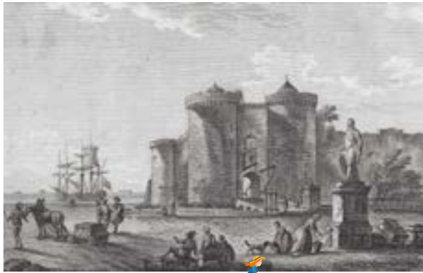
Vieux Palais et statue Henri IV par Jadoulle