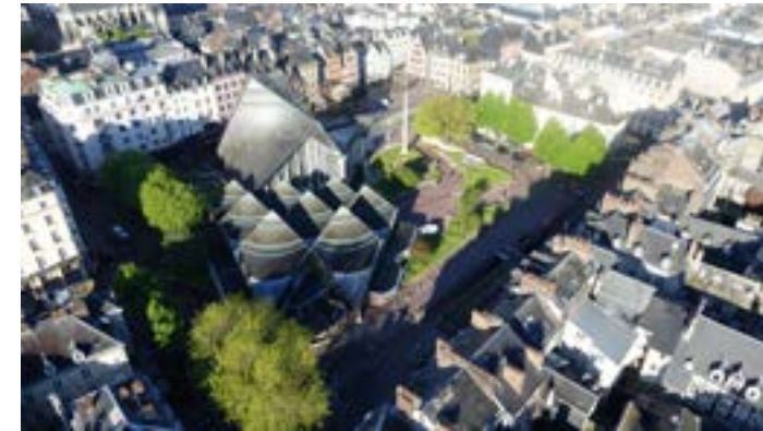
Toitures des halles du marché couvert et de l'église Sainte-Jeanne-d'Arc