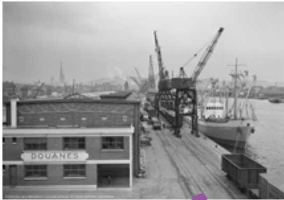
Quai de Seine - années 1950