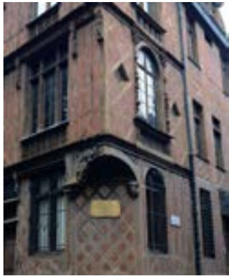
Bâtiment du 19 e siècle en pan-de-bois