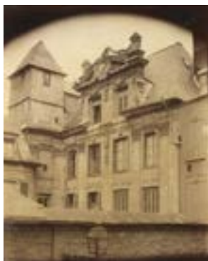
Eugène Atget, Hôtel Girancourt: 48 rue Saint-Patrice, 1907 © Bibliothèque municipale de Rouen, Est. rec. m 171-05.

De nombreux notables, siégeant au Parlement de Normandie, cour de justice de l'époque, s'installent dans le quartier Saint-Patrice où se construisent, dès le 17 e siècle, de somptueux hôtels particuliers. Ils évitent ainsi de se déplacer entre leurs terres, châteaux et manoirs, situés à la campagne et Rouen. Si l'église est ouverte, n'hésitez pas à entrer admirer les vitraux et l'ensemble la décoration (tableaux, mobiliers).