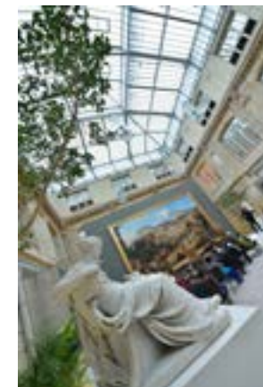
Intérieur du Musée des Beaux-Arts de Rouen