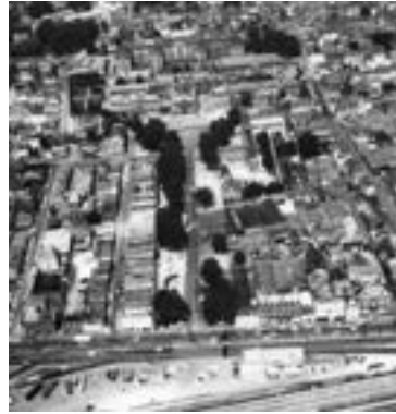
Avenue Pasteur vers 1970