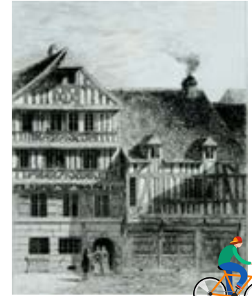
Maison des deux Corneille