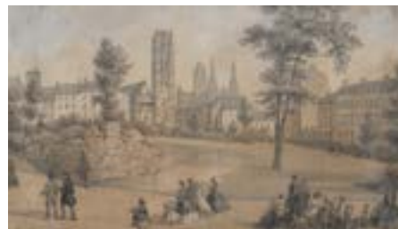
Square Verdrel vers 1860