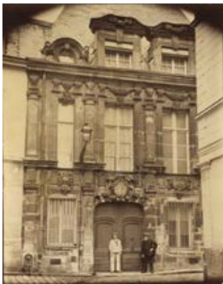
Eugène Atget, Hôtel d'Arras: 38, rue Saint-Patrice, 1907 © Bibliothèque municipale de Rouen, Est. rec. m 171-08