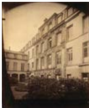
Eugène Atget, Cour de l'Hôtel d'Arras: 38, rue Saint-Patrice, 1907 © Bibliothèque municipale de Rouen, Est. rec. m 171-27.