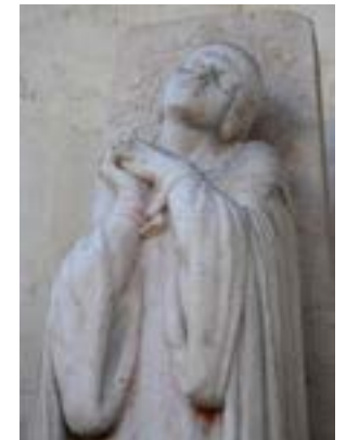
Statue de Jeanne d'Arc

Jeanne d'Arc est suppliciée sur cette place le 30 mai 1431.