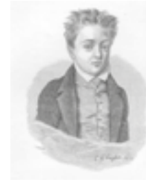
Portraits de Gustave Flaubert à différents âges