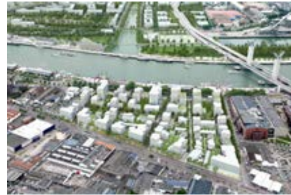
Vue axonométrique du projet du quartier Luciline