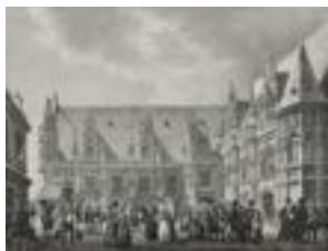
Palais de justice - Taylor et Nodier « Voyages pittoresques et romantiques en ancienne France » © Bibliothèque municipale de Rouen (U_49_4_pl164_d)