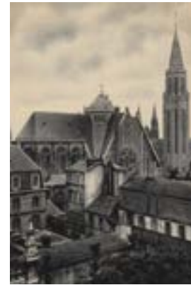
Eglise Saint-Nicaise