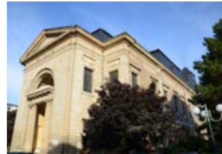
Chapelle Notre-Dame-de-la-Charité