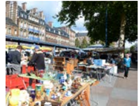
Marché au Clos Saint-Marc