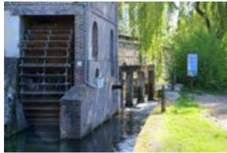
Moulin des Dames de Saint-Amand