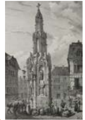
Gravure de l'ancienne fontaine de la Croix-de-pierre Taylor et Nodier « Voyages pittoresques et romantiques en ancienne France » © Bibliothèque municipale de Rouen (U_49_4_pl168_d)