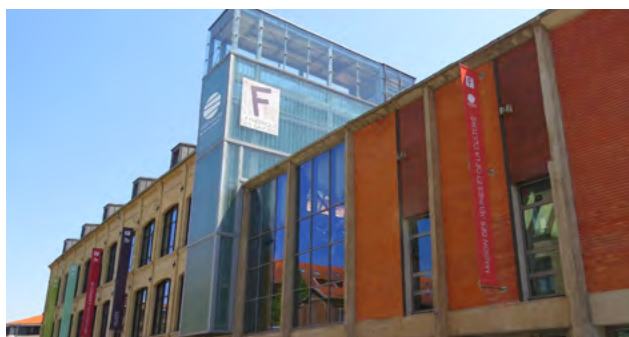
La Fabrique des savoirs