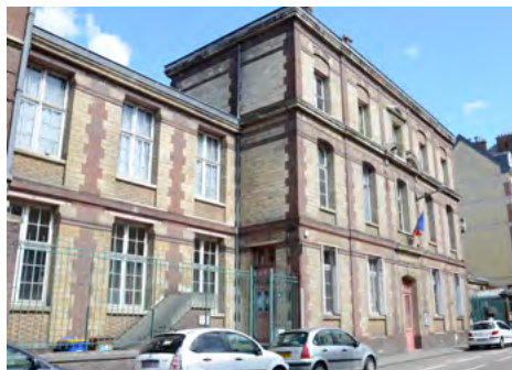
Atelier Victor Hugo

www.metropole-rouen-normandie.fr/patrimoines/espace-enseignants