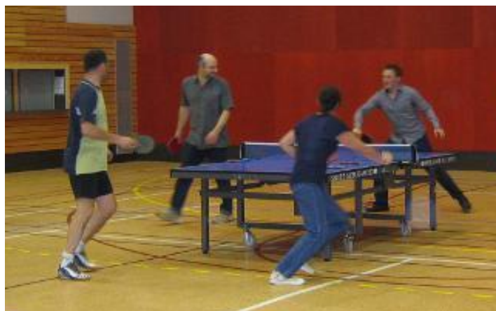
Tableau final (après midi) : La Ronde Rouen Normandie Sup Cup