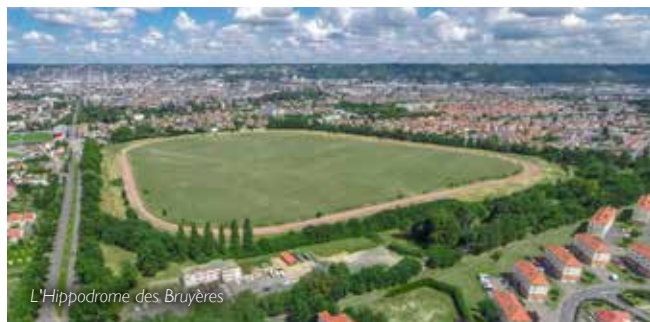
L'Hippodrome des Bruyères

→ Parvis de l'église, rue Guynemer, Elbeuf-sur-Seine Gratuit sans réservation