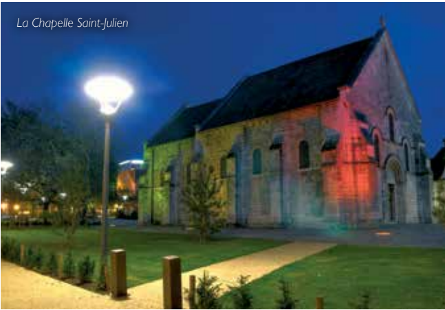
La Chapelle Saint-Julien