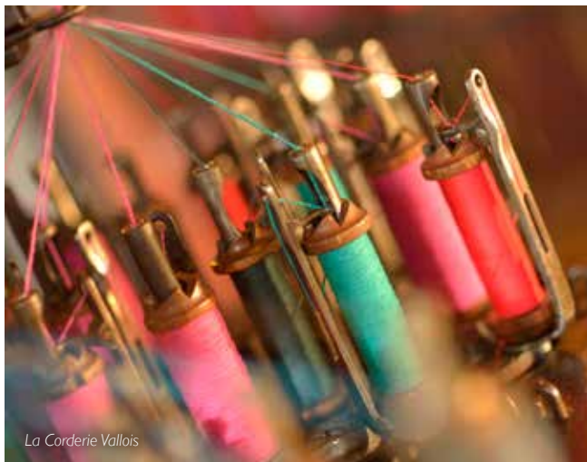
La Corderie Vallois

Partez à la découverte de chacun de ces lieux, non pas à travers leurs collections, mais sous l'angle historique et architectural, depuis leur intégration urbaine jusqu'à leur aménagement intérieur. Une autre manière d'appréhender à la fois la diversité et la richesse de nos musées.