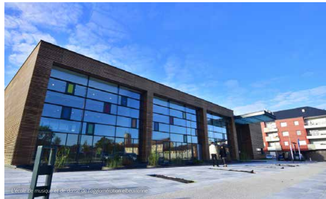
L'école de musique et de danse de l'agglomération elbeuvienne

→ devant le 6-8 rue André-Gantois, Saint-Aubin-lès-Elbeuf Gratuit Réservations au 02 35 71 85 45 (Maison de l'Architecture)