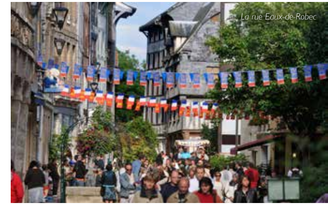
La rue Eaux-de-Robec

→ Devant l'église Saint-Clément, Place Saint-Clément, Rouen Gratuit sans réservation