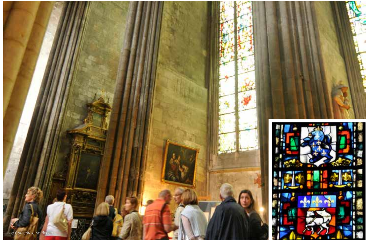
La Cathédrale de Rouen

Visite littéraire proposée dans le cadre d'Elbeuf à la Page, manifestation culturelle de la médiathèque de la Ville d'Elbeuf-sur-Seine → Fabrique des savoirs, 7, cours Gambetta, Elbeuf-sur-Seine Gratuit sans réservation