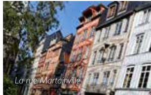
La rue Martainville