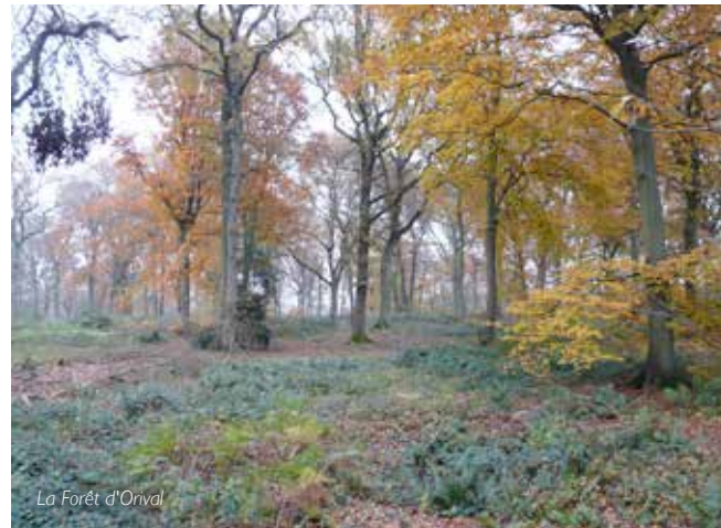
La Forêt d'Orival

→ Fabrique des savoirs, 7, cours Gambetta, Elbeuf-sur-Seine (départ en covoiturage) Gratuit sur réservation 02 32 96 30 40