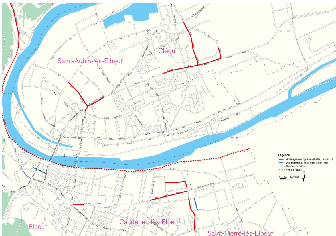
Réseau de pistes cyclables sur le territoire elbeuvien dont la trame bleue