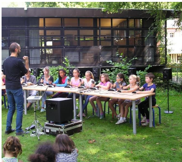
Les enfants utilisent un joystick relié à un ordinateur et au logiciel de la « Méta-mallette » pour émettre en temps réel des sons des machines de la Corderie Vallois, préalablement enregistrés.