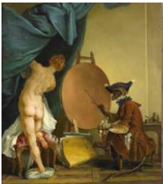
Anonyme français – XVIIIe siècle, Le singe peintre, huile sur toile

À l'heure où les artistes ouvrent leurs portes, le musée des Beaux-Arts de Rouen propose également au grand public de découvrir dans ses collections des œuvres évoquant des ateliers d'artistes. Sujet récurrent dans l'histoire de l'Art, ces lieux de création et de formation invitent à s'interroger sur le regard que l'artiste porte sur lui-même et son histoire parfois surprenante.