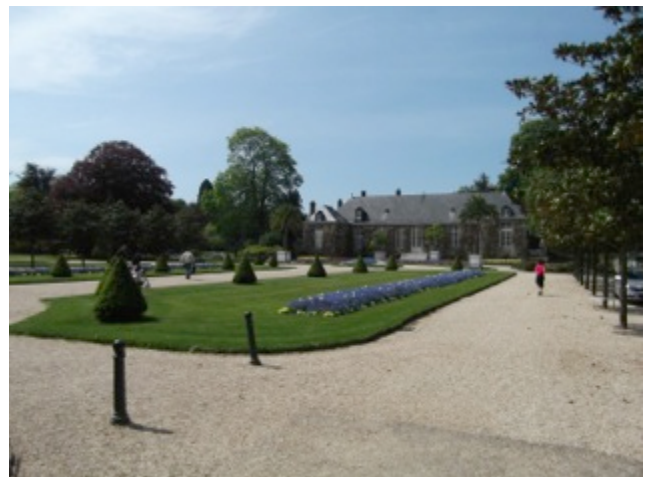
Jardin des Plantes