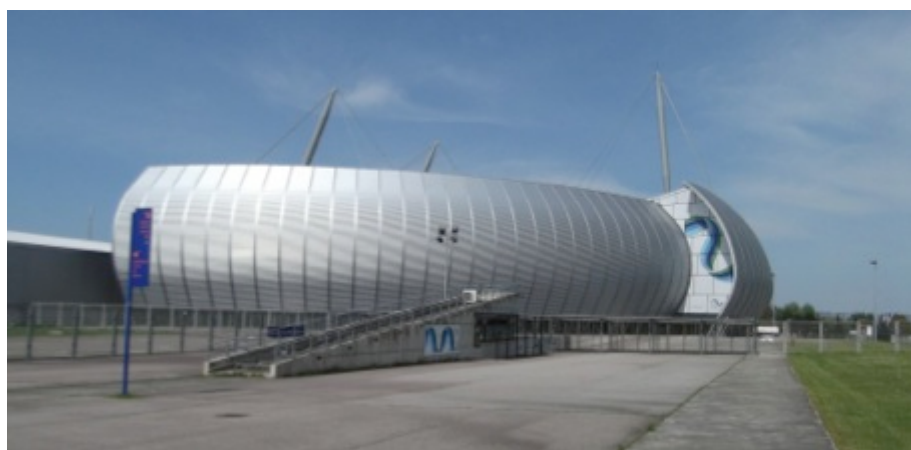
Zénith de la CREA

Le cheminement est protégé sur une bonne partie de l'itinéraire grâce à une piste cyclable en site propre.