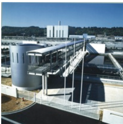
Station d'épuration Emeraude