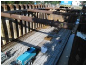
Le bassin de Grand Quevilly, avant le coulage de la dalle de béton

Actuellement, sur le territoire de la CREA, il existe 196 bassins de régulation des eaux pluviales à ciel ouvert et 26 bassins enterrés, représentant une capacité totale de stockage supérieure à 560 000 m 3 .