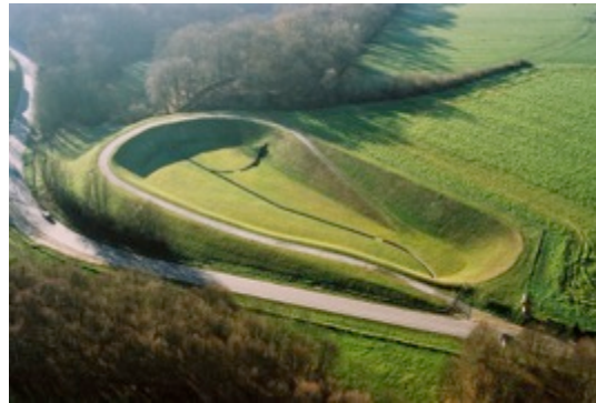
Bassin de rétention à ciel ouvert, Route de Belbeuf, Franqueville-Saint-Pierre

Pour la Direction de l'eau de la CREA, les ouvrages concernés sont :